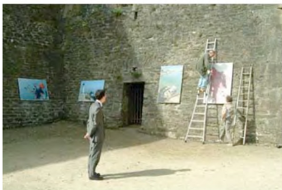
EXPOSITION CITADELLE VAUBAN (52 tirages 100x150 cm)