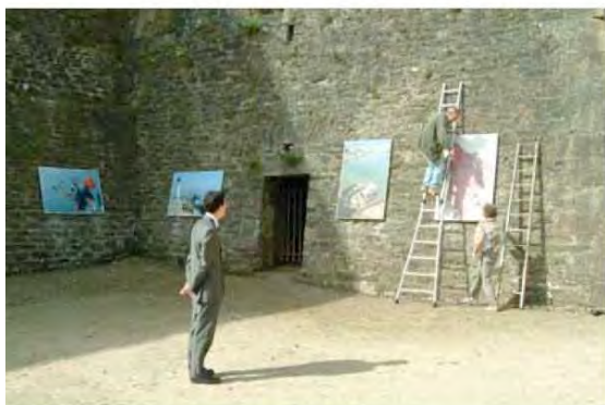
EXPOSITION CITADELLE VAUBAN (52 tirages 100x150 cm)